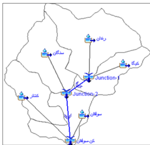
شکل ۲. زیرمدل حوزه آبخیز کن

اقلیمی، و شاخص‌های کنترلی تکمیل شود. در زیرمدل حوزه روش‌هایی وجود دارد برای تعیین تلفات اولیه، محاسبه رواناب سطحی، محاسبه آب پایه، و روندیابی سیل در رودخانه. زیرمدل اقلیمی، در کنار مدل حوزه، یکی دیگر از مؤلفه‌های لازم برای شبیه‌سازی هیدرولوژیکی حوزه در HEC-HMS است. کلیه داده‌های بارندگی و تبخیر و تعریق در حوزه از طریق