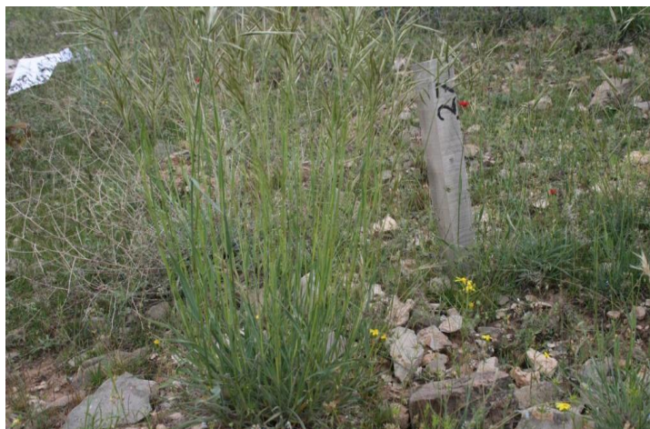
شکل ۱. تصویری از گونه بروموس در داخل قرق

بخش تحقیقات مرتع مؤسسه تحقیقات جنگل‌ها و مراتع کشور حمل شد و، پس از خشک‌شدن در هوای آزاد و توزین نمونه‌ها، وزن علوفه خشک مبنای محاسبات علوفه تولیدشده و مصرف‌شده در سایت قرار گرفت. با مقایسه تولید گونه در ماه‌های مختلف روند رفتار رویشی گونه در مرتع تعیین و زمان حداکثر تولید آن معین شد. با مقایسه مصرف دام از گونه در ماه‌های مختلف، زمان و میزان استفاده از