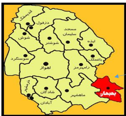
شکل ۱. موقعیت شهرستان بهبهان در ایران و استان خوزستان

خاتم‌الانبیاء شهرستان بهبهان استان خوزستان انجام گرفت. شهرستان بهبهان در جنوب شرقی استان خوزستان قرار دارد و هم‌مرز با شهرهای استان کهگیلویه و بویراحمد است. محدوده طول جغرافیایی آن ۱۴° ۵۰ و در عرض ۳۶° ۳۰ قرار دارد. میانگین حداقل دمای سالانه ۱۸/۱ درجه سانتی‌گراد و میانگین حداکثر دمای سالانه ۳۲/۳۷ درجه سانتی‌گراد می‌باشد. میانگین تبخیر سالانه در دوره آماری ۱۶ ساله ایستگاه سینوپتیک بهبهان ۳۴۲۲/۳ میلی‌متر در سال است. حداکثر رطوبت نسبی در ماهانه در دی‌ماه برابر ۸۰٪ و حداقل رطوبت نسبی در خرداد ماه برابر ۱۵٪ می‌باشد. میانگین بارندگی سالانه ۳۵۴/۲ میلی‌متر است (شکل ۱).