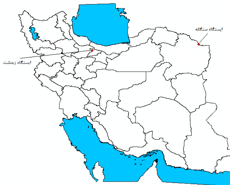
شکل ۱. سمت راست) موقعیت ایستگاه سنگانه (استان خراسان رضوی) و ایستگاه زیدشت (استان البرز) در کشور.

طالقان استان البرز به مختصات ۴۰^{\circ} ۵۰' طول شرقی و ۱۲^{\circ} ۳۶' عرض شمالی قرار داشته و ارتفاع آن از سطح دریا ۱۵۳۰ متر می‌باشد (شکل ۱). متوسط بارش (بارش مایع) سالانه این ایستگاه در حدود ۳۳۶ میلی‌متر می‌باشد. میانگین ماهانه بارش در طول دوره آماری ۲۰۱۳-۲۰۰۲ نیز در شکل ۲ نشان داده است. بر این اساس بیشترین مقدار بارش در منطقه در ماه آوریل