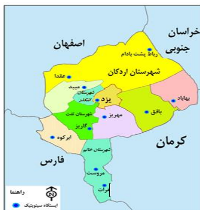
شکل ۱. موقعیت استان یزد و حوزه آبخیز رودخانه اعظم هرات

به‌طور کلی هدف از این مطالعه در ابتدا تحلیل خشکسالی هیدرولوژیک با استفاده از شاخص‌های مختلف و تعیین مناسب‌ترین شاخص جهت بررسی خشکسالی در منطقه مطالعاتی می‌باشد. در نهایت تعیین ارتباطی که بین خشکسالی هواشناسی و خشکسالی هیدرولوژیک وجود دارد به ما کمک می‌کند تا به فاصله زمانی و یا تأخیری که بین زمان وقوع خشکسالی هواشناسی و خشکسالی هیدرولوژیک پی ببریم. اطلاع از این فاصله زمانی به مدیران و برنامه‌ریزان برای مقابله با تأثیرات منفی ناشی از وقوع خشکسالی هواشناسی کمک خواهد کرد و از اثرات احتمالی ناشی از خشکسالی هیدرولوژیک در آینده جلوگیری می‌کند، چرا که اطلاع از تأخیری که