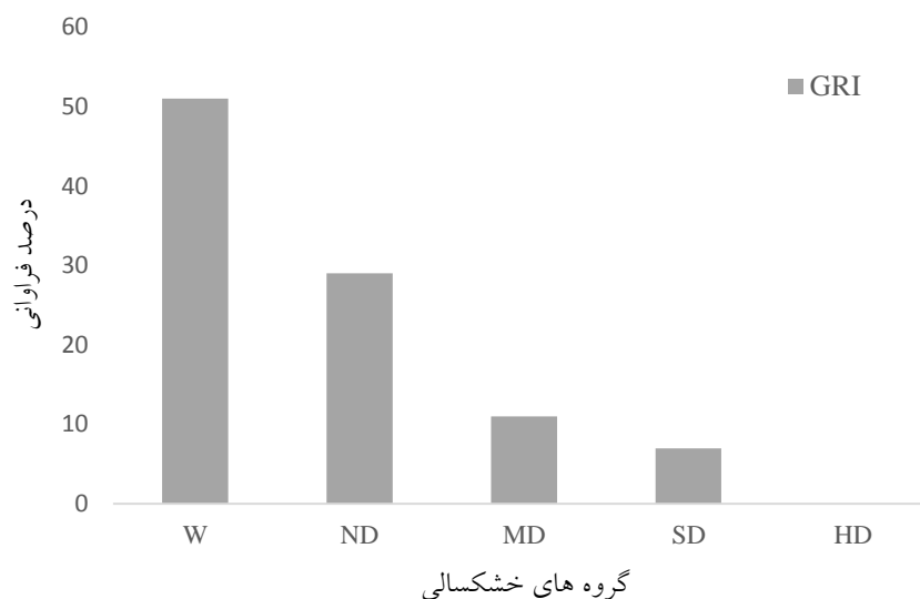
شكل ۴. فراواني گروه‌هاي خشكسالي آب‌يرزميني براساس شاخص GRI

مقادير منطقه‌اي پارامترهاي نظير بارندگي وجود دارد كه از پركاربردترين روش‌ها، روش تيسن و روش‌هاي درون‌يابي زمين آمار مي‌باشد. روش تيسن به دليل وجود اختلاف ارتفاع در نقاط مختلف حوزه و عدم پوشش مثلث‌هاي حاصل از آن در سطح حوزه مناسب نمي‌باشد. از اين رو، جهت تخمين مقادير متوسط بارش و دما در سطح كل حوزه از روش‌هاي زمين آمار استفاده شد. از بين روش‌هاي موجود روش معكوس فاصله انتخاب گرديد. در اين روش از فاصله به عنوان وزن متغير معلوم در پيش‌بيني نقاط