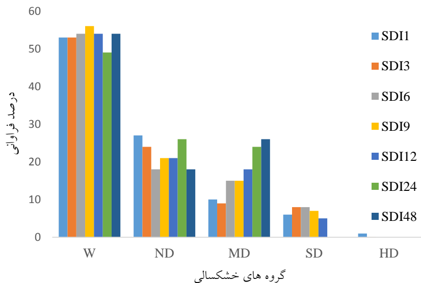
شکل ۳. فراوانی گروه‌های خشکسالی هیدرولوژیکی بر اساس شاخص SDI

درون‌یابی معکوس فاصله استفاده گردید و مقادیر متوسط ماهانه سطح آب‌زیرزمینی از نقشه‌های حاصل استخراج گردید. بر اساس رابطه شاخص GRI در محیط برنامه MATLAB دوره‌های خشکسالی تعیین گردید. نتایج حاصل از تجزیه و تحلیل شاخص GRI در جدول ۲ ارائه