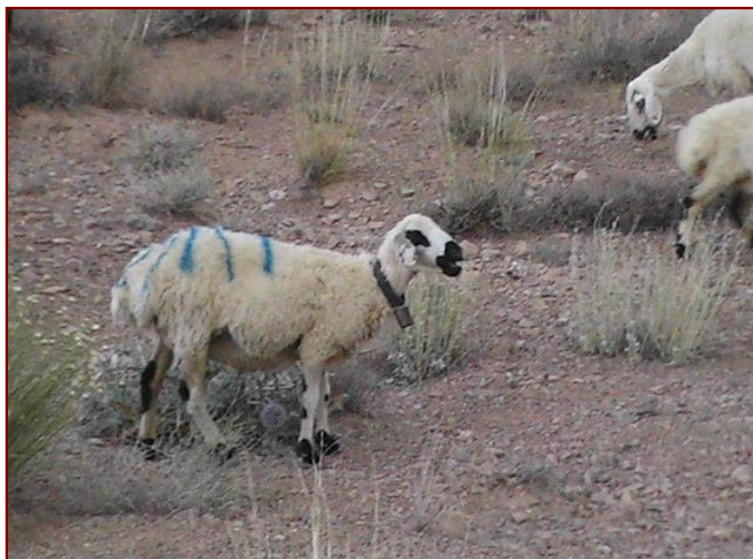
شکل ۳. میش چهار ساله گوسفند نژاد نایینی چرا کننده در مراتع استپی میمه

به دام انتخاب شده در هنگام چرا، تأثیر مجاورت بر رفتار چرای دام از بین برود. پس از اطمینان از عدم تغییر رفتار چرای دام در اثر مجاورت آمار برداران، زمان چرای هر یک از گونه‌های گیاهی توسط دام، با دوربین، فیلمبرداری شد. در این خصوص، در یک روز معین در هر ماه از فصل رویش، در سه دوره ۲۰ دقیقه‌ای، از دام فیلمبرداری شد. ساعت فیلمبرداری، زمانی از طول روز بود که دام‌ها نه زیاد سیر و نه خیلی گرسنه بودند. این زمان در هر روز، در یک دوره زمانی ۱۰ ساعته، از ساعت ۸:۳۰ تا ۱۸:۳۰ بود. پس از انجام فیلمبرداری، فیلم‌های ثبت شده، مورد بازبینی قرار گرفت و مدت زمان چرای دام بر روی