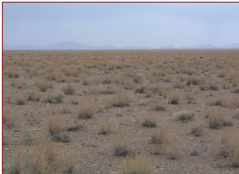
شکل ۲. نمایی کلی از پوشش گیاهی مراتع نیمه استپی میمه (اسفندماه، ۱۳۸۶)