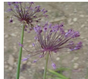
بن سرخ ( Allium Jesdianum )