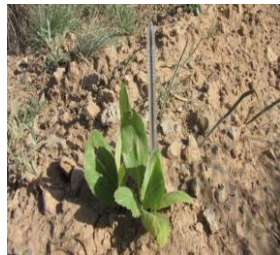
کلوس ( Kelussia odoratissima )