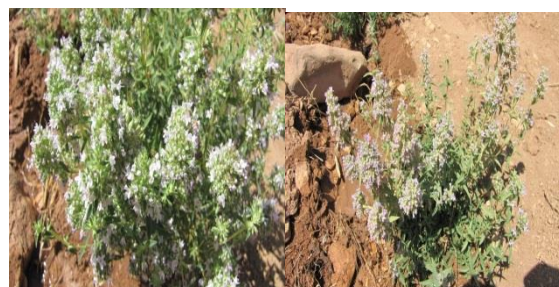
آویشن دنايي ( Thymus daenensis )

شکل ۲. تصویر گونه‌های دارویی مراتع علی‌آباد موسیری در استان چهارمحال و بختیاری