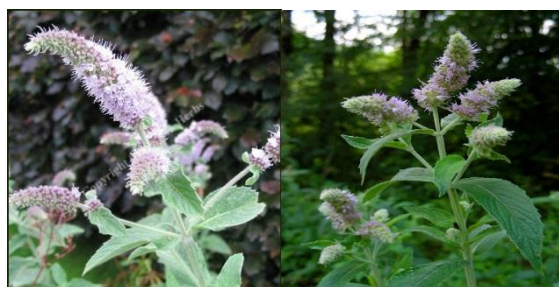
پونه ( Mentha longifolia )