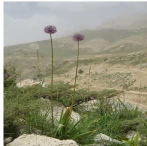
موسیر ( Allium hirtifolium )