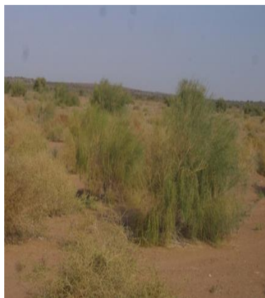
نمائی از تیپ گیاهی Salsola richteri