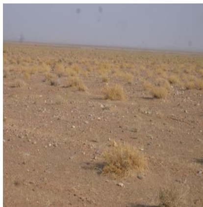
نمائی از تیپ گیاهی Scariola orientalis