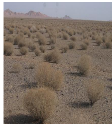
نمائی از تیپ گیاهی Artemisia sieberi