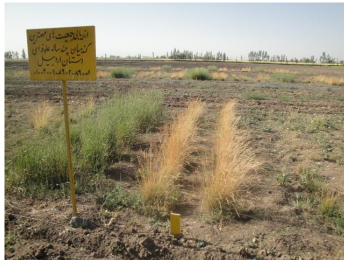
شکل ۲. گونه‌های کشت شده در عرصه ایستگاه تحقیقاتی سامیان-اردبیل

حسب سانتی‌متر مربع تعیین شد. مقاومت در برابر آفات و بیماری‌ها: در این بررسی تنها وقوع آفات و بیماری مورد نظر است و مشاهده یا عدم مشاهده آفات و بیماری‌ها ثبت شده‌اند. تولید علوفه: در مرحله رشد کامل گیاه، بیومس اندام‌های هوایی پایه‌ها به طور جداگانه برداشت و پس از خشک شدن در هوای آزاد با ترازوی نیمه حساس توزین گردید، سپس بر حسب تعداد پایه در هکتار تولید در هکتار محاسبه شد. تولید بذر: تولید بذر با برداشت سنبله‌ها در هر لاین و پس از جدا نمودن بذر از غلاف و